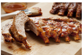
Porc grillé, rôtié ou avec sauce foncée