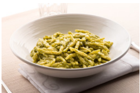
Pâtes au pesto