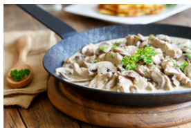
Veau avec sauce claire