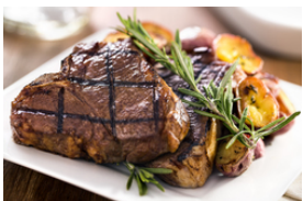
Rind mit hellen Saucen