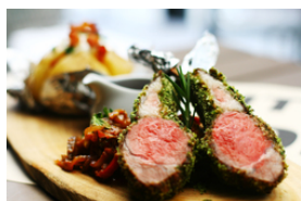
Agneau grillé ou rôti